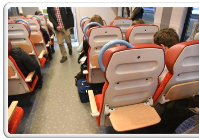
EN76 „Elf”, SA139 „Link”